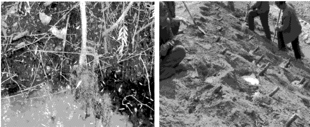
图3 柳树种植及其根系分布 [8,9]

(2)树干与堆石的相互作用。与北方岸坡相比,南方岸坡因坡度、土体性质、河道断面形式及月流量不均等因素影响,岸坡常被水流淘刷严重,因而不同类型堆石体要进行亲水性护坡。岸坡铺设一定尺寸及级配的堆石体后,不同粒径颗粒间以堆叠、衔接、咬合等方式搭建堆石体空间结构,颗粒间摩擦作用为影响堆石岸坡稳定主要因素;活树桩根部与下部土体紧密相连,类似倒“T”形式紧固与岸坡土体,树干在堆石岸坡中调节部分颗粒排布及其粒间力传递,将部分自重以弯矩形式传递至下部土层 [10] 。