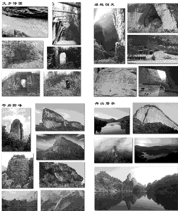
表2 山地丘陵景观图