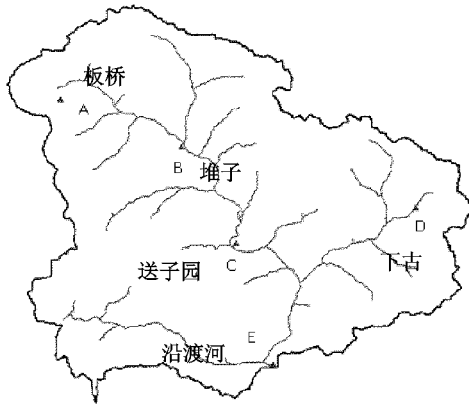
图 2 沿渡河流域雨量站分布图

最终得出三组不同划分方式,分别将流域划分成 4、6、8 个计算单元,然而在各种划分方式的图中,计算单元的面积大小相似,由于划分方式的限制,无法将流域计算单元的面积划分的完全一样,只能大致相同。